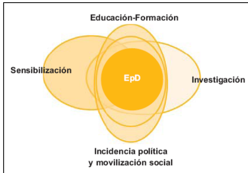
Ilustración 1. Dimensiones de la Educación para el Desarrollo. Ortega Carpio, 2008